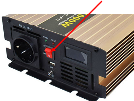
obr. č. 1 – přepínač v poloze 0 = vypnuto