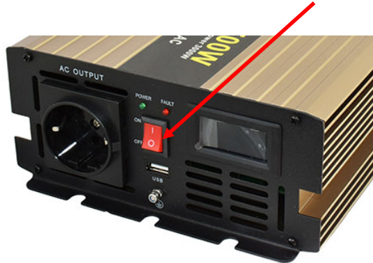
obr. č. 2 – přepínač v poloze I = zapnuto